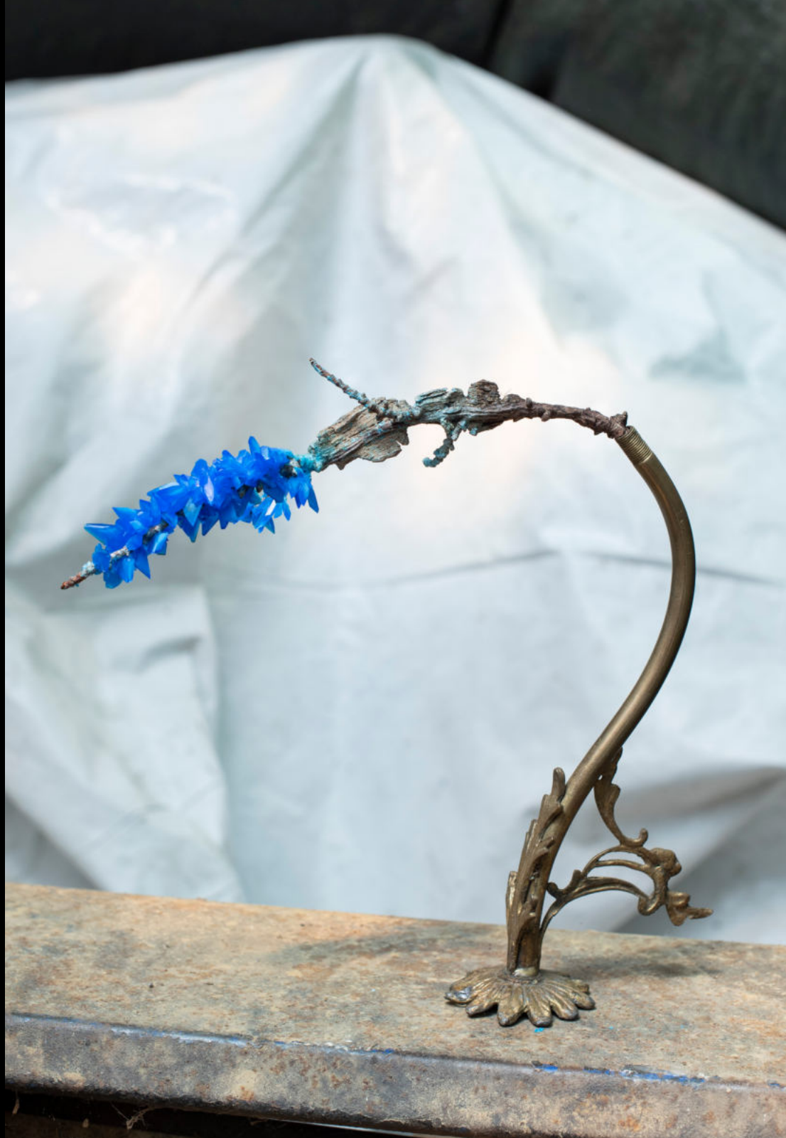
Ignis fatuus (formed by lightfire) 2022 |Ottone, ramo di sughero e solfato di rame| 35 x 25 x 7