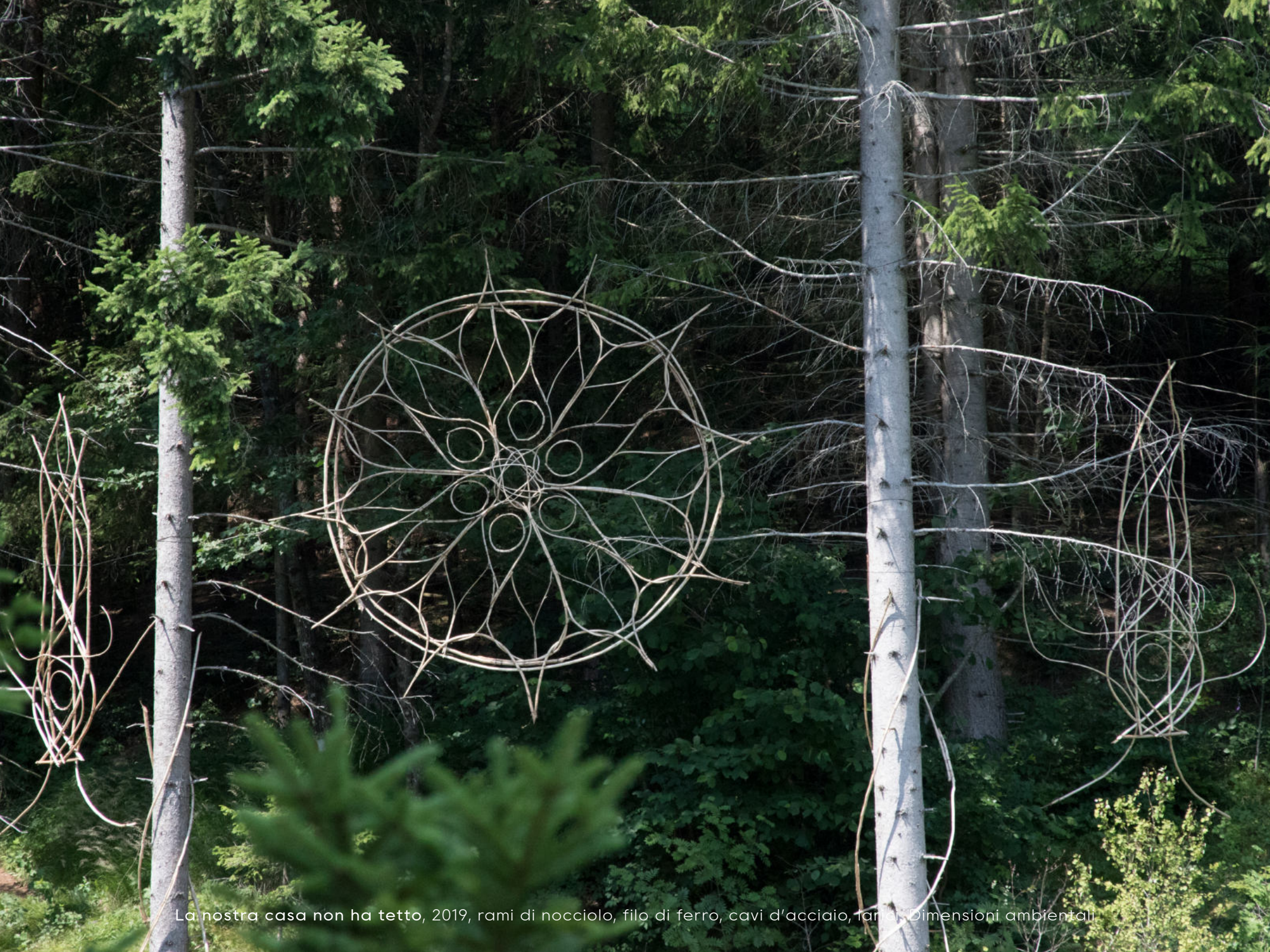
La nostra casa non ha tetto, 2019, rami di nocciolo, filo di ferro, cavi d'acciaio, rammi. Dimensioni ambientali