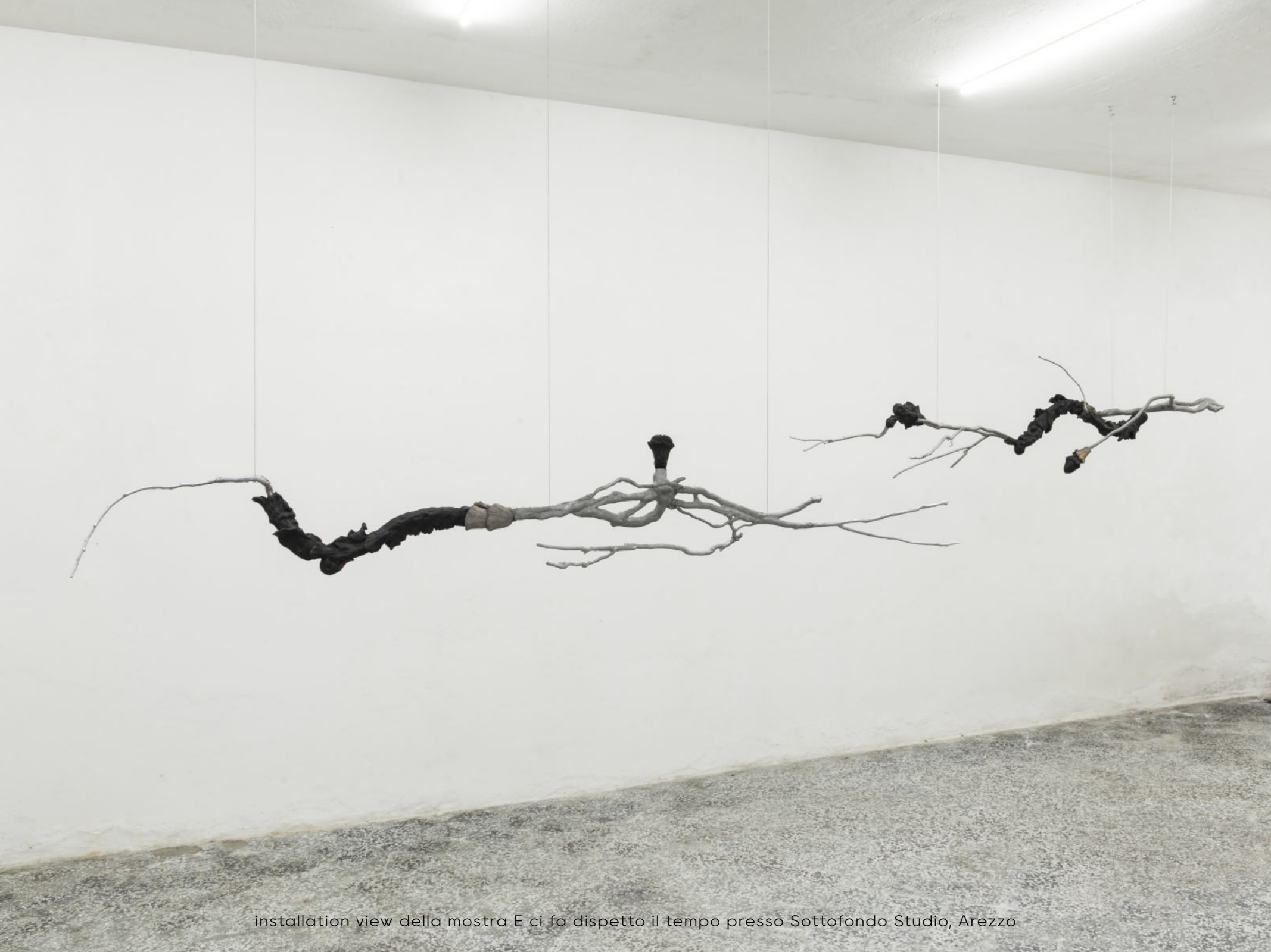
installation view della mostra E ci fa dispetto il tempo presso Sottofondo Studio, Arezzo