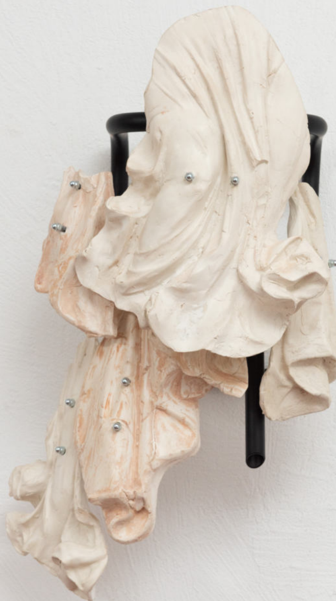
Ricordo rimosso 2021|Terracotta, ferro, dadi zincati| 100 x 45 x 50