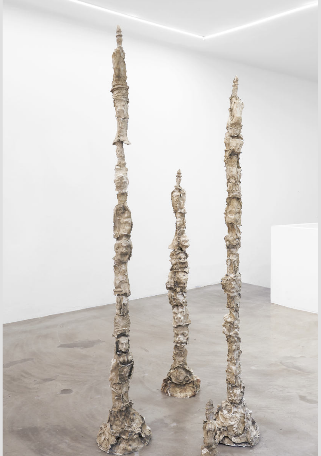
Senza titolo (il limite della neve) 2021 |Marmo sintetico, ferro| dimensioni variabili