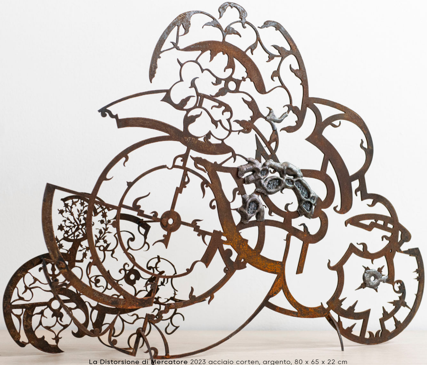
La Distorsione di Mercatore 2023 acciaio corten, argento, 80 x 65 x 22 cm