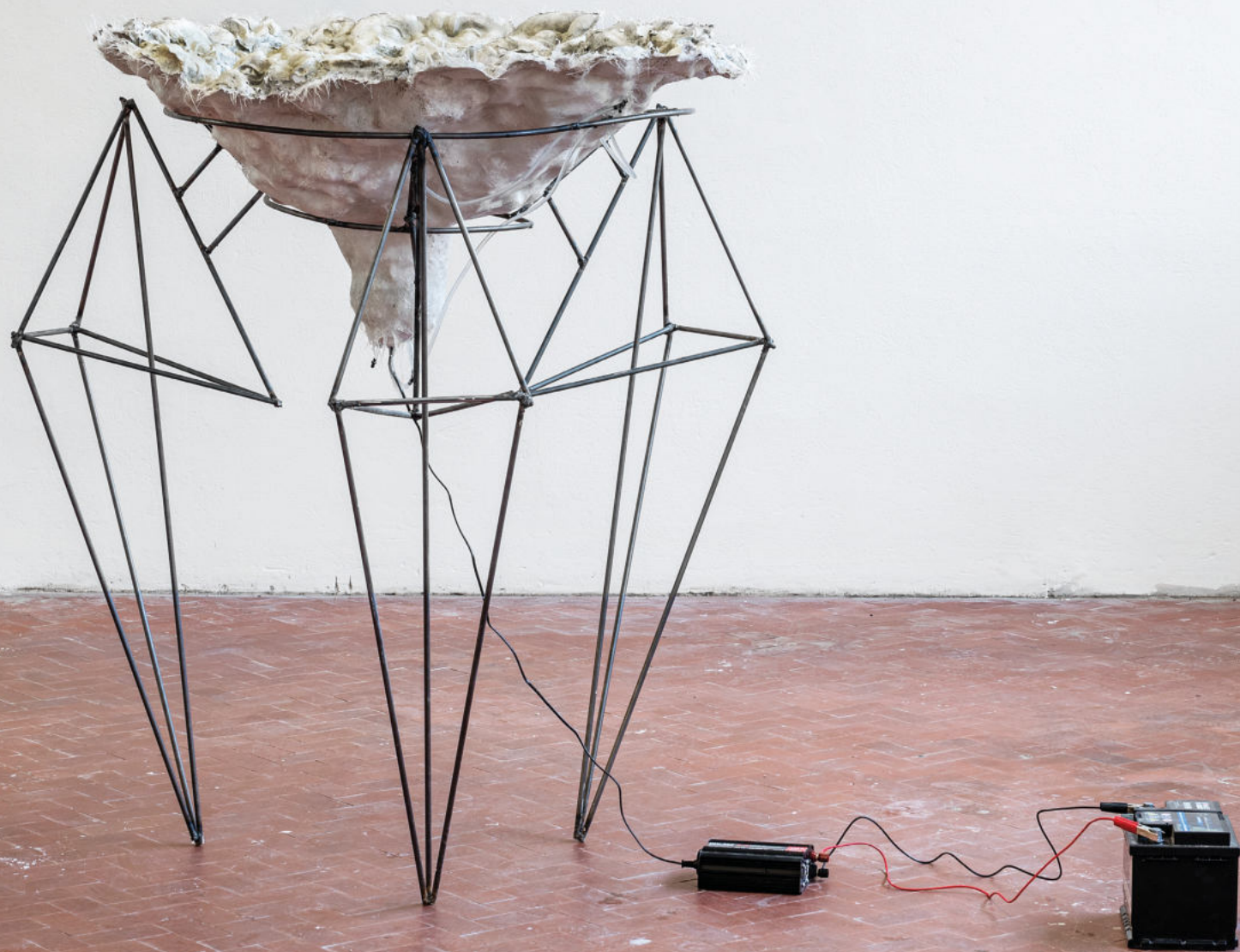
Caligine (Il limite della neve) 2021 marmo sintetico, ferro, acqua, fibra di vetro, silicone, resina, pompa, tubi, batteria. 160 x 160 cm circa