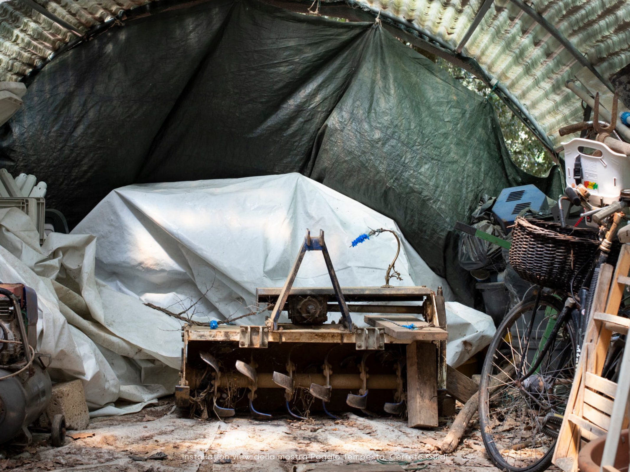
installation view della mostra Poggio Tempesta, Cerreto Guidi