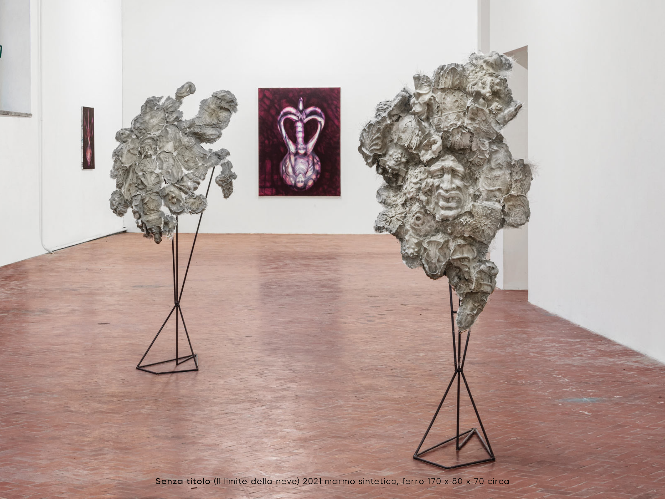
Senza titolo (Il limite della neve) 2021 marmo sintetico, ferro 170 x 80 x 70 circa