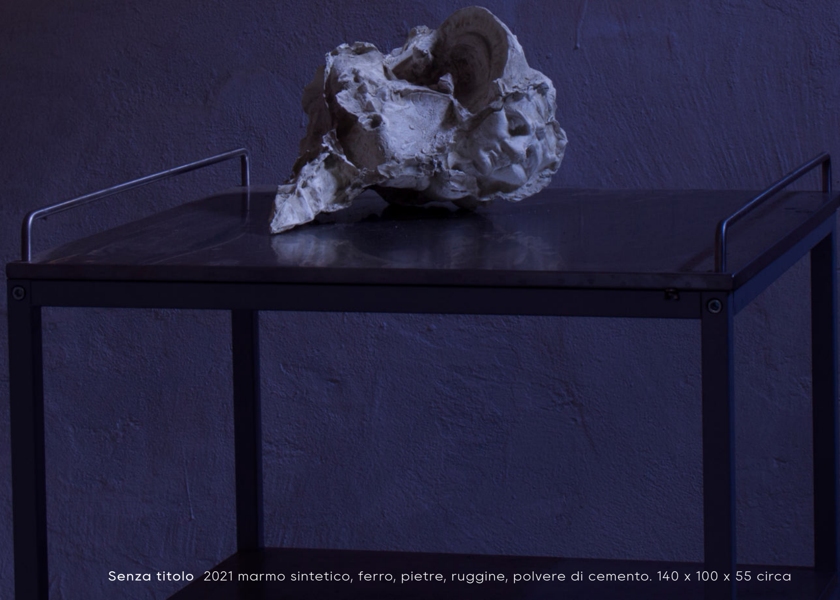
Senza titolo 2021 marmo sintetico, ferro, pietre, ruggine, polvere di cemento. 140 x 100 x 55 circa