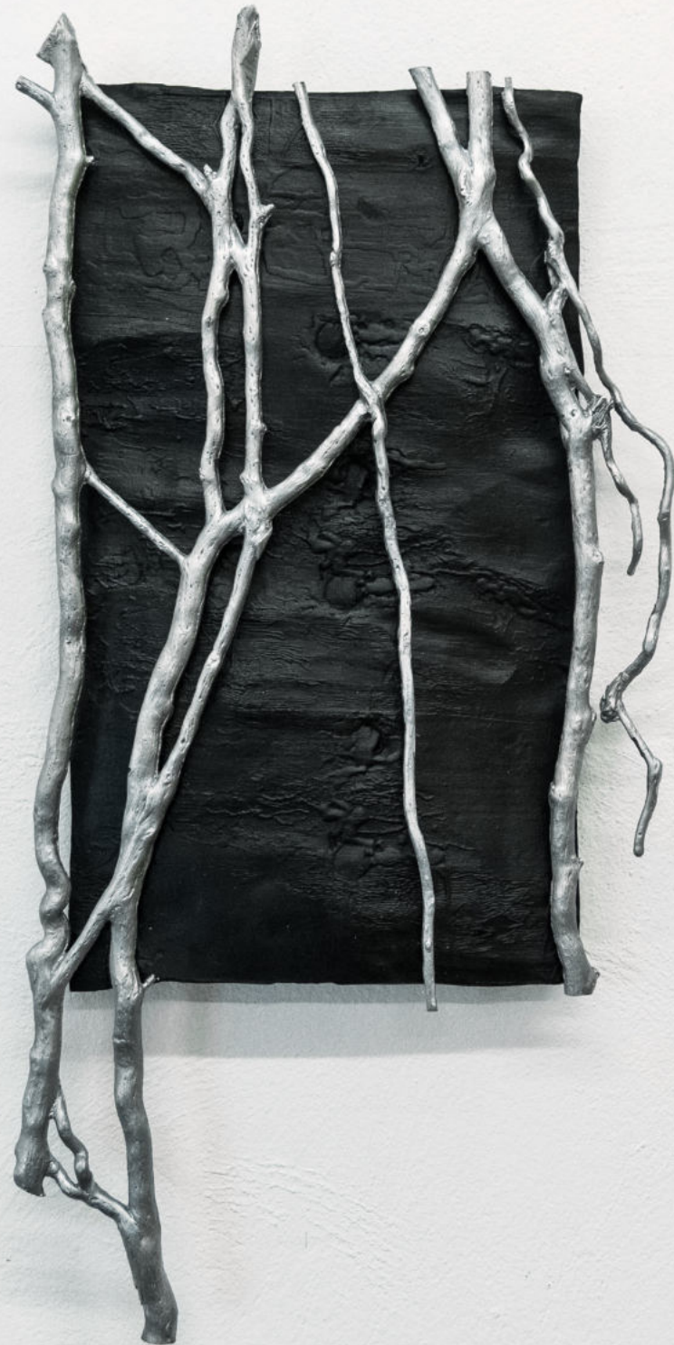
Viscere di Selce 2023 |Terracotta, alluminio| 40 x 18 x 4