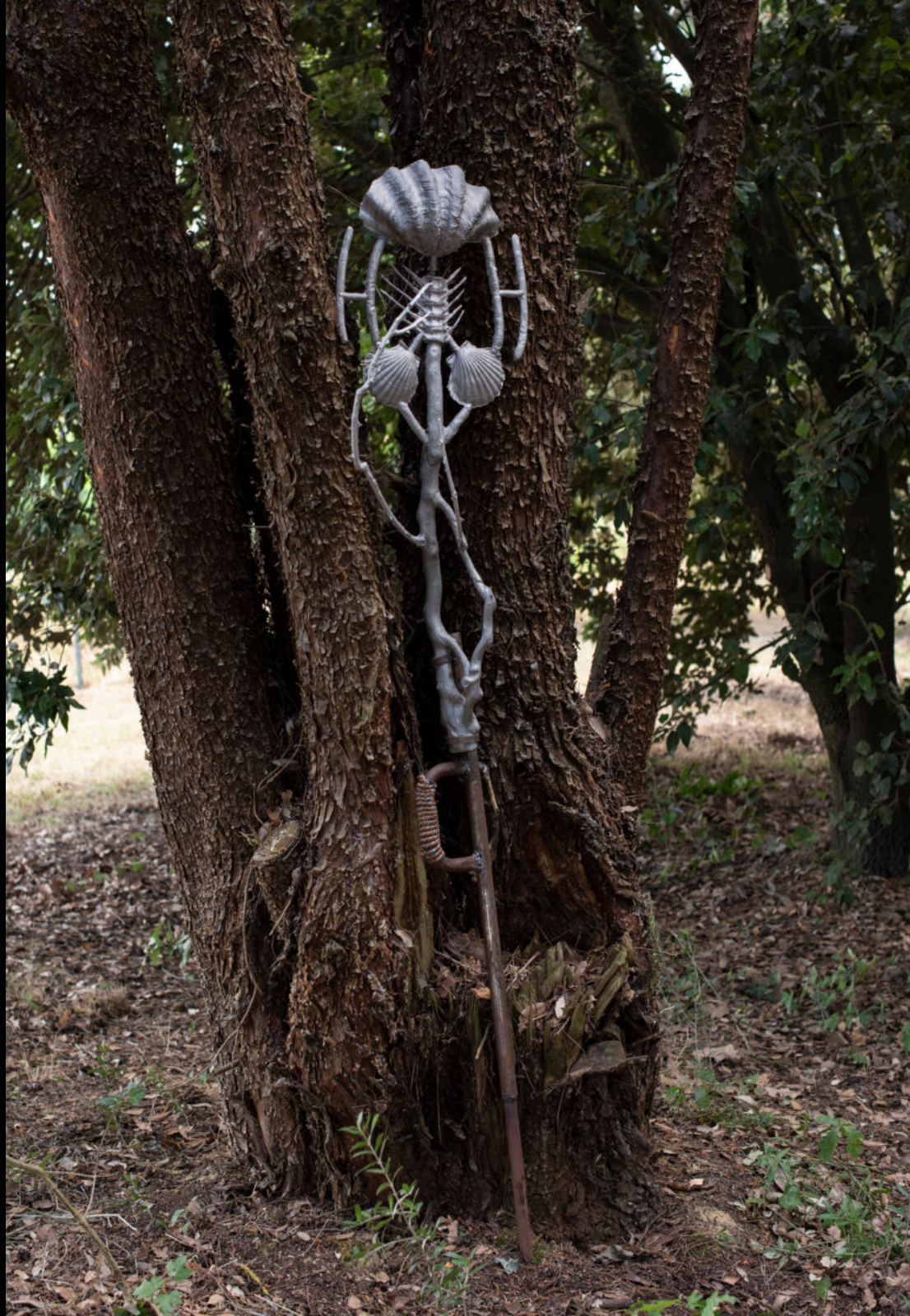
Formed by lightfire III 2022 | Alluminio, ferro, corda | 170 x 45 x 30