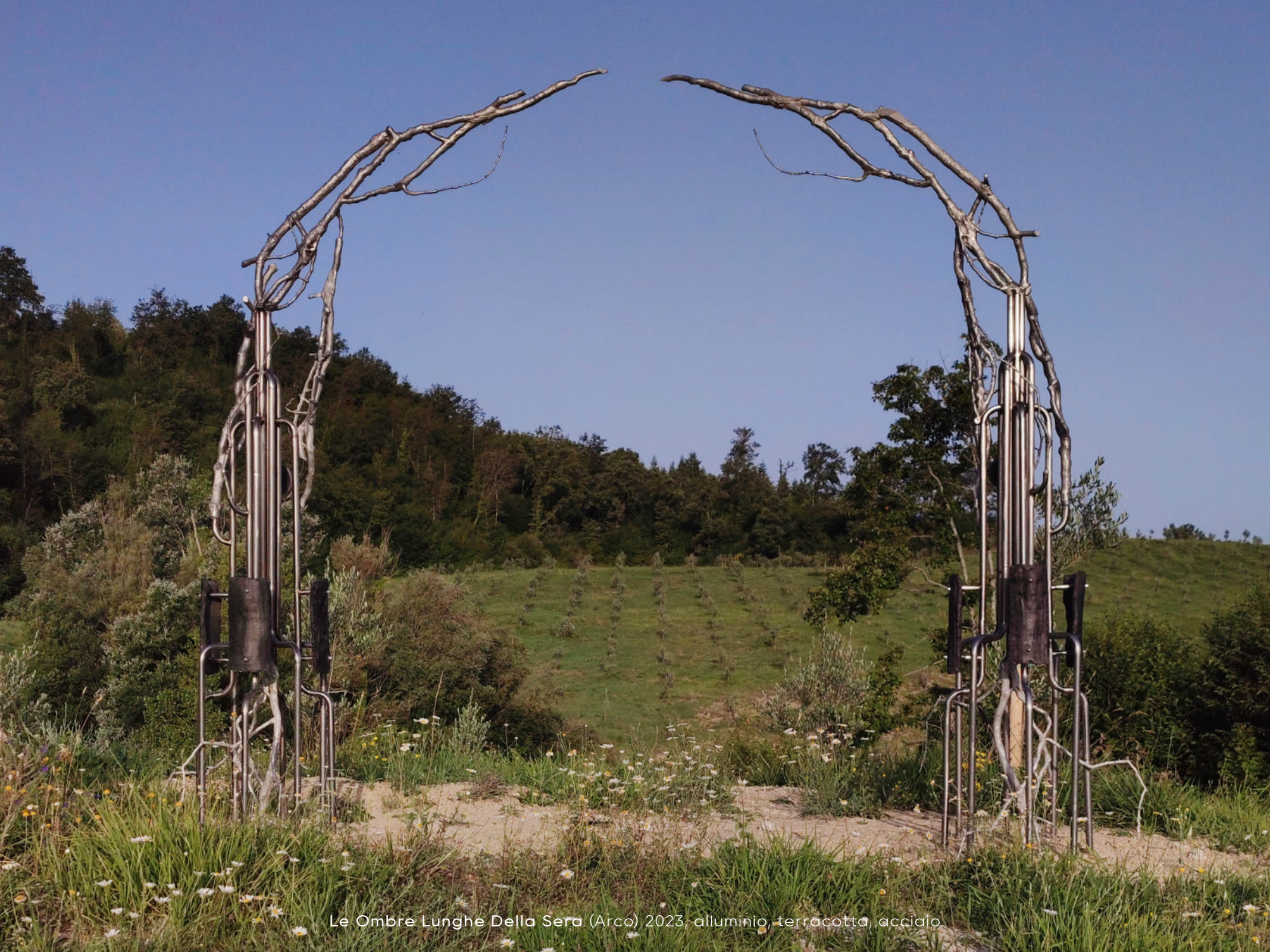
Le Ombre Lunghe Della Sera (Arco) 2023, alluminio, terracotta, acciaio