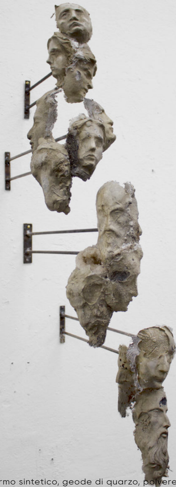
Giovane come la notte 2021 marmo sintetico, geode di quarzo, polvere di ferro, ferro dimensioni variabili