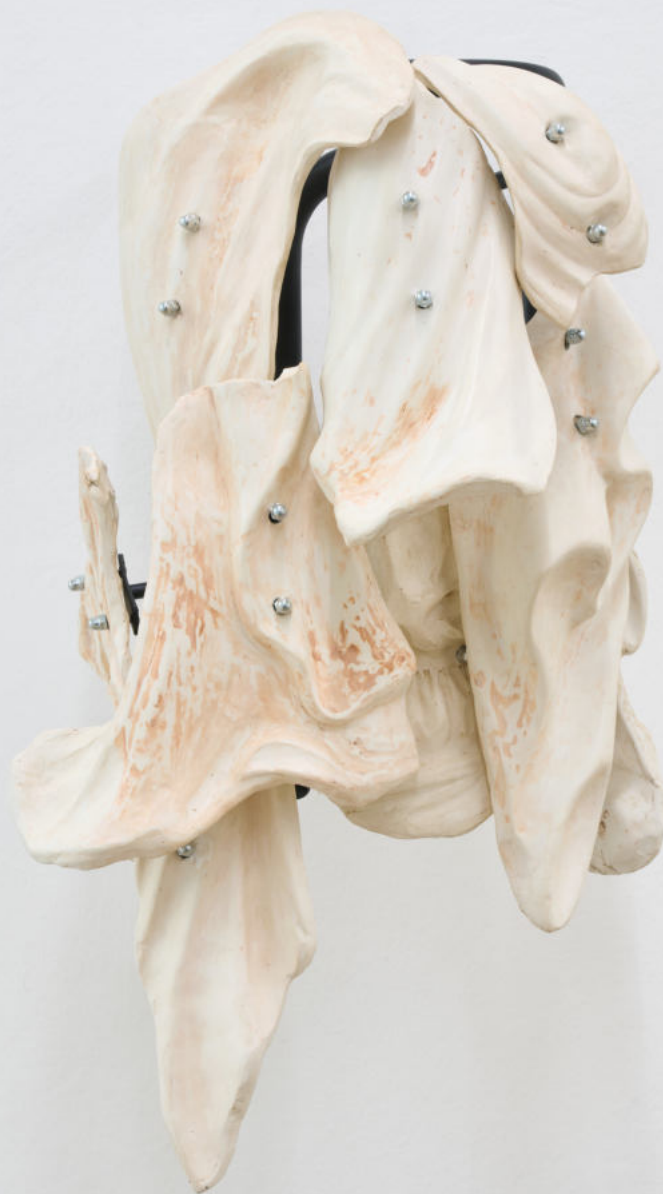
Ricordo rimosso 2021|Terracotta, ferro, dadi zincati| 95 x 50 x 48