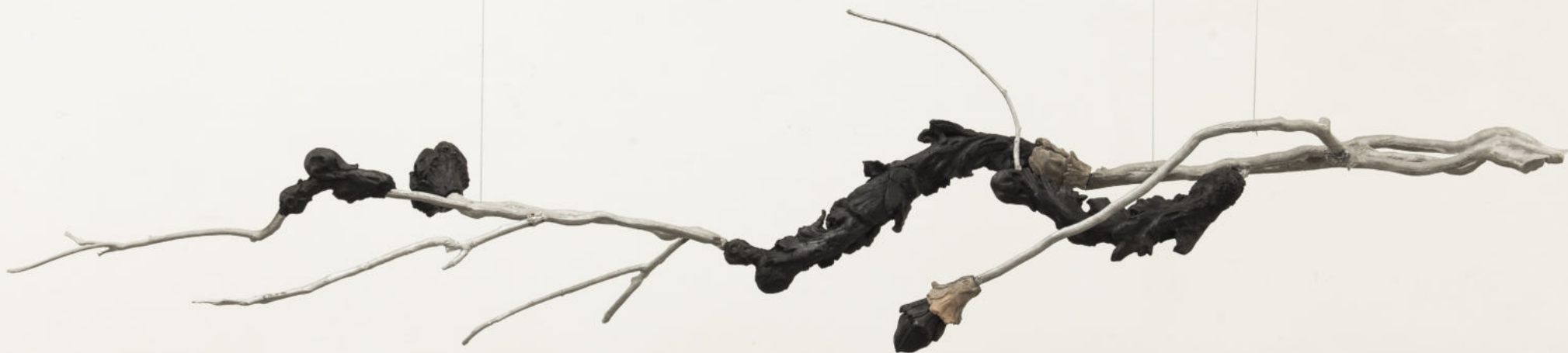
Se non bruciamo come si illuminerà la notte? (II) terra cotta con tecnica a bucchero e alluminio. 250 x 60 x 40