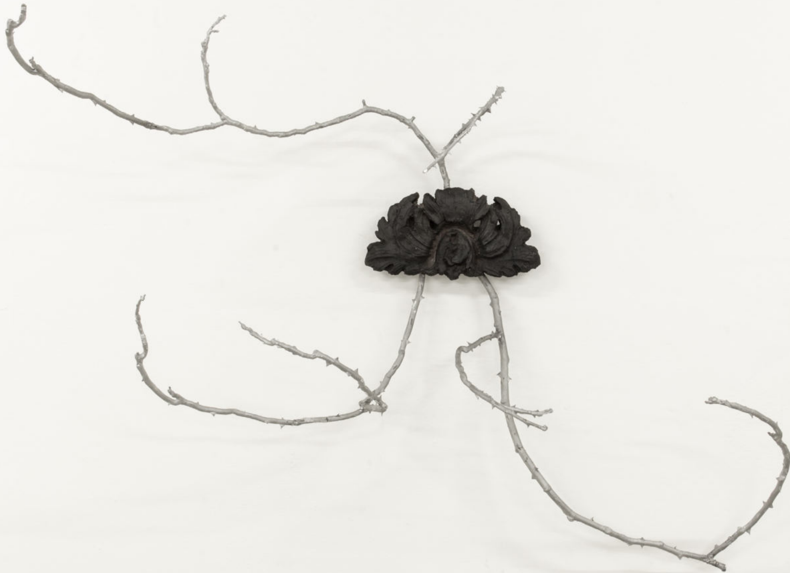
Se non bruciamo come si illuminerà la notte? (III) terra cotta con tecnica a bucchero e alluminio. 170 x 130 x 45