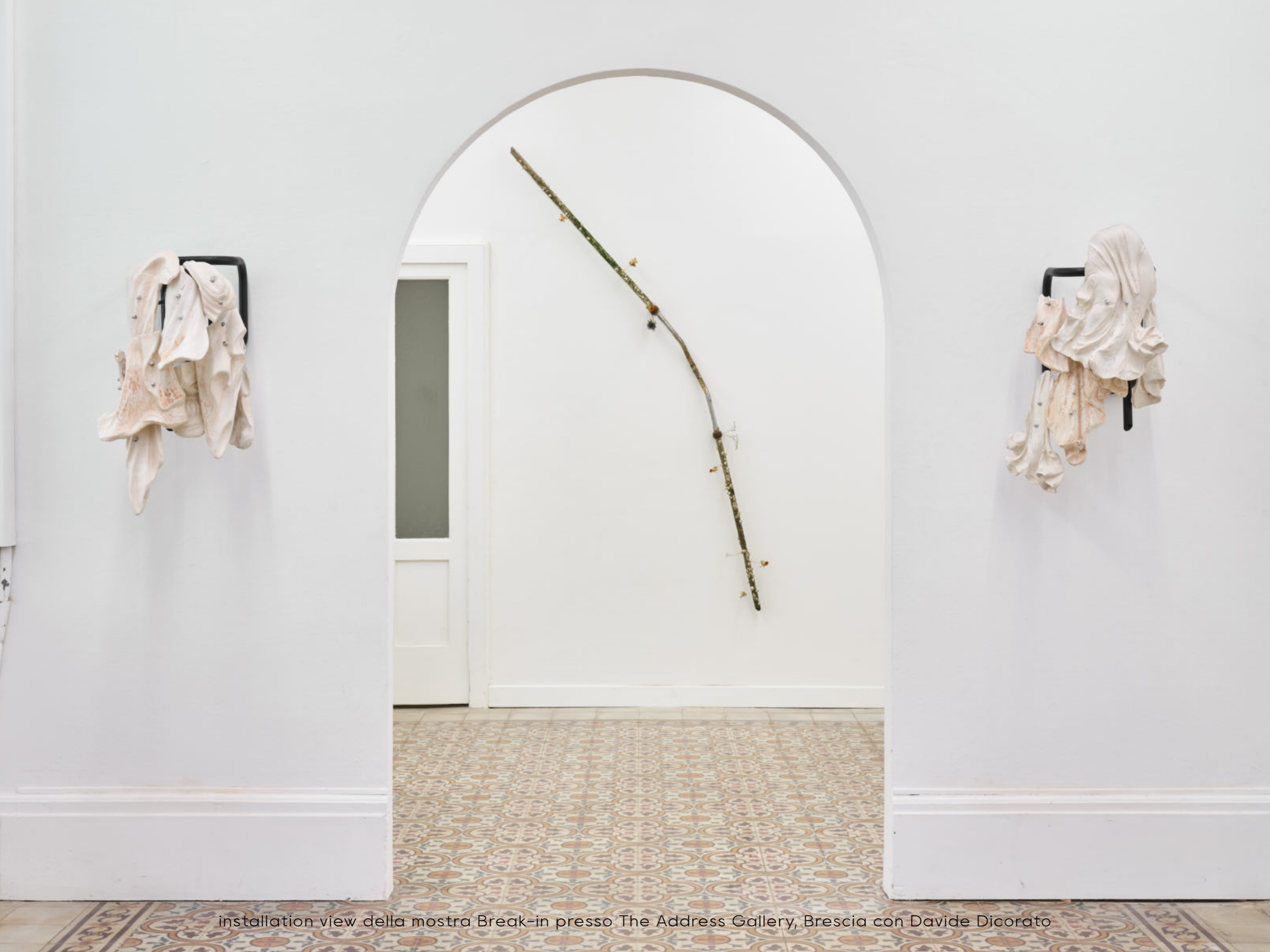
installation view della mostra Break-in presso The Address Gallery, Brescia con Davide Dicorato