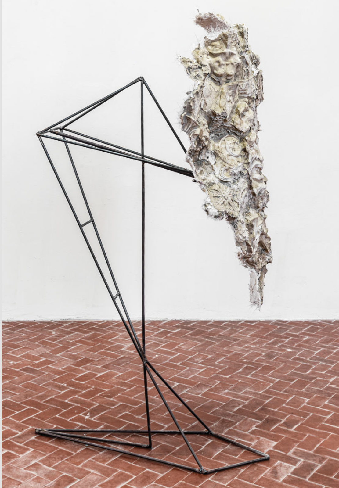
Senza titolo (il limite della neve) 2021 | Marmo sintetico, ferro | 170 x 80 x 70