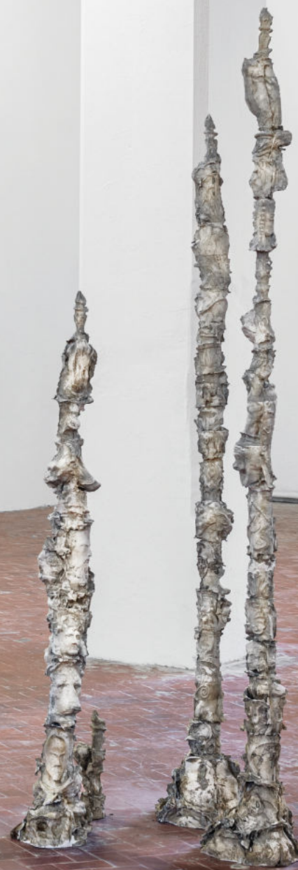
installation view della mostra L'Armonia presso Manifattura Tabacchi Firenze con Ludovica Anversa Senza titolo (Il limite della neve 2021 marmo sintetico, ferro, dimensioni variabili)