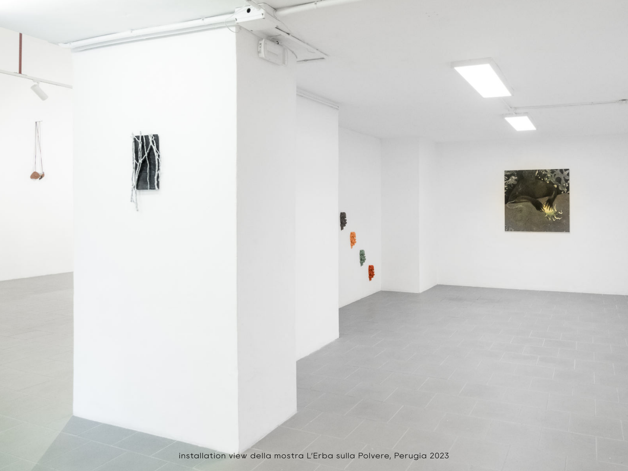
installation view della mostra L'Erba sulla Polvere, Perugia 2023