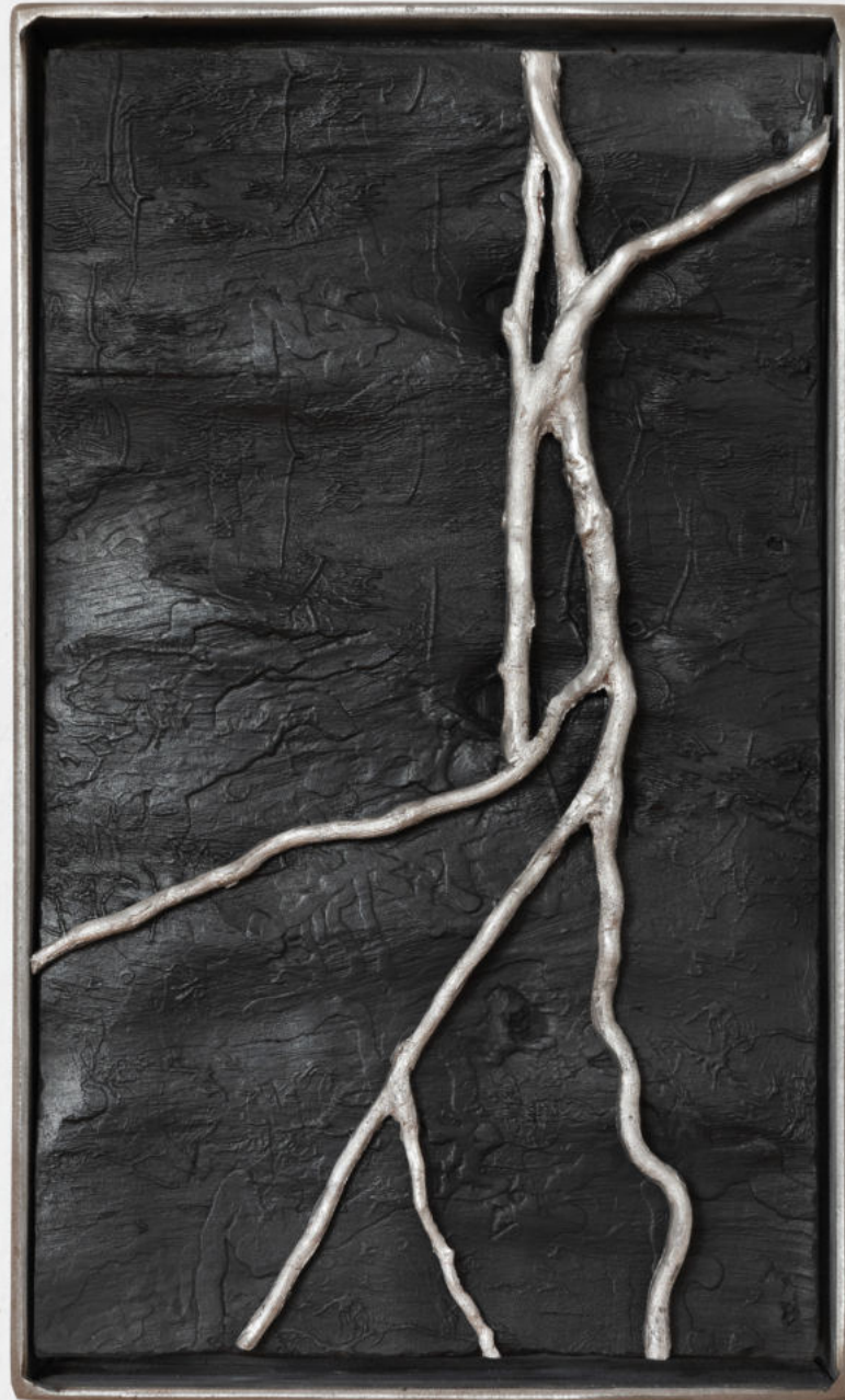
Viscere di Selce 2023 |Terracotta, stagno| 30 x 18 x 5