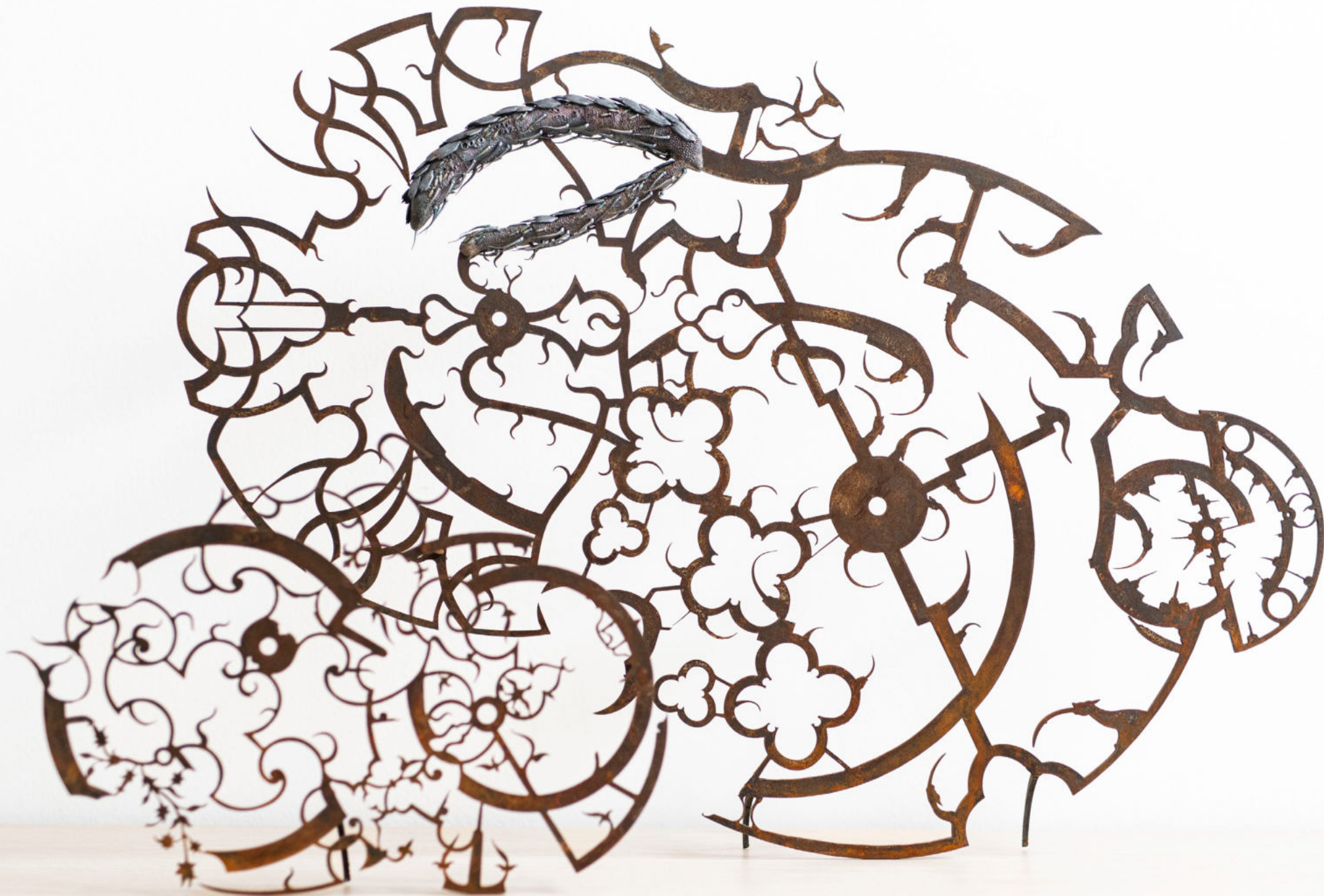
La Distorsione di Mercatore 2023 acciaio corten, argento, 80 x 65 x 22 cm