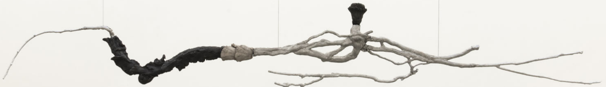
Se non bruciamo come si illuminerà la notte? (I) terra cotta con tecnica a bucchero e alluminio. 220 x 30 x 15